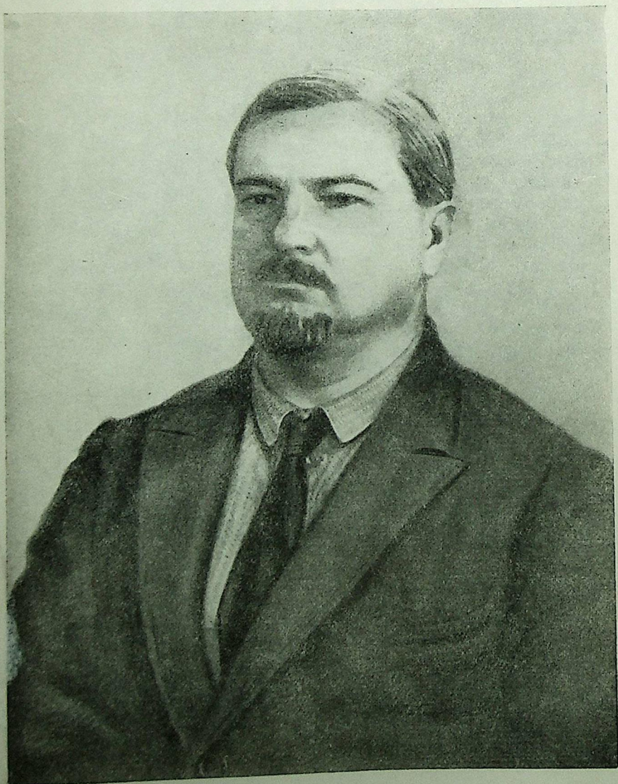
Борис Митрофанович Даньшин (1891—1941)